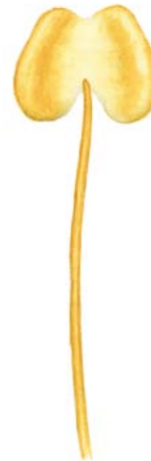
Oben: Samen im Inneren der Hagebutte, der Frucht der Rose. Unten: ein Staubblatt der Rosenblüte.