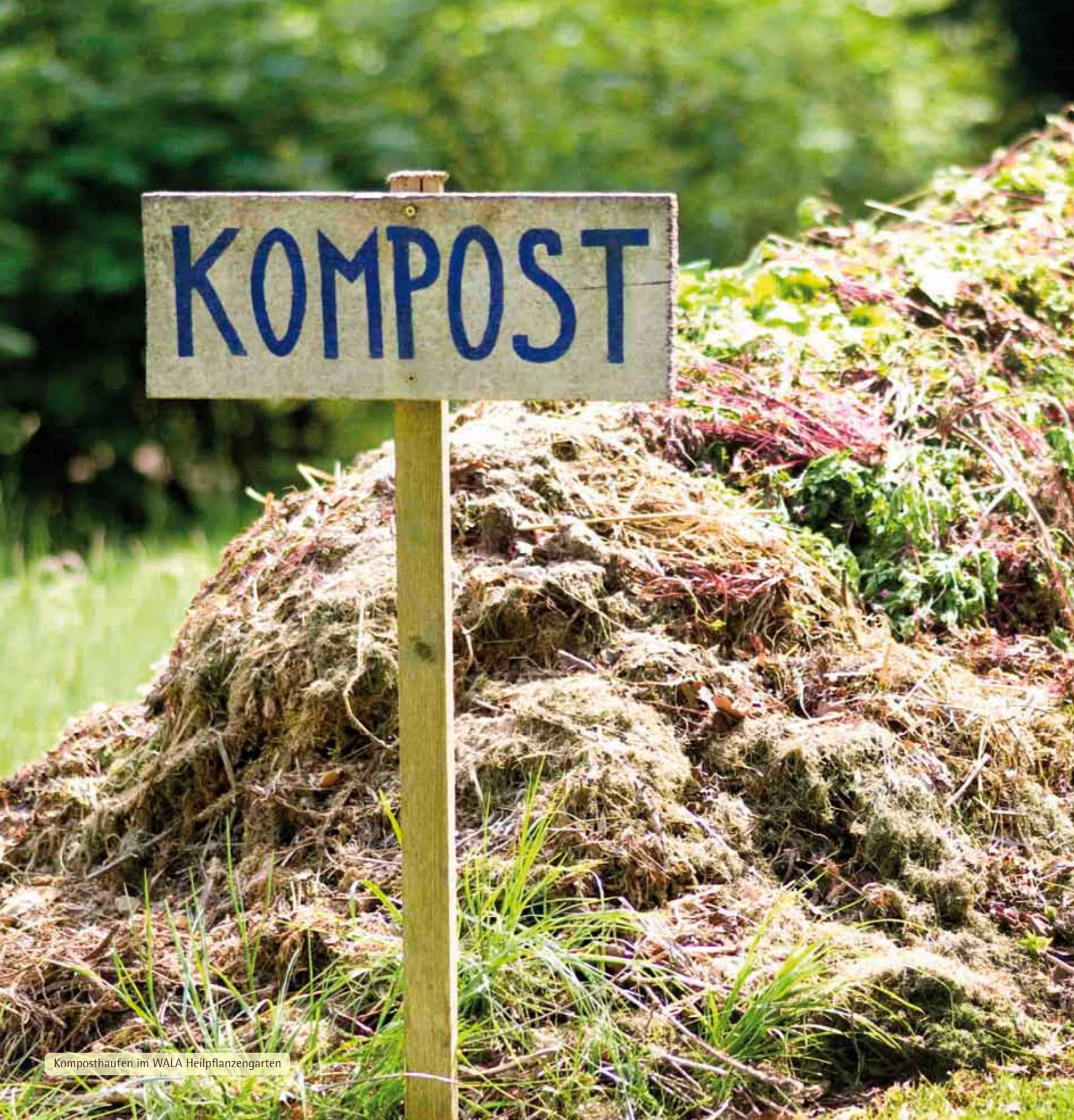
Komposthaufen im WALA Heilpflanzengarten

„Wir müssen eigentlich furchtbar dankbar sein, daß der Mist übrig bleibt.“