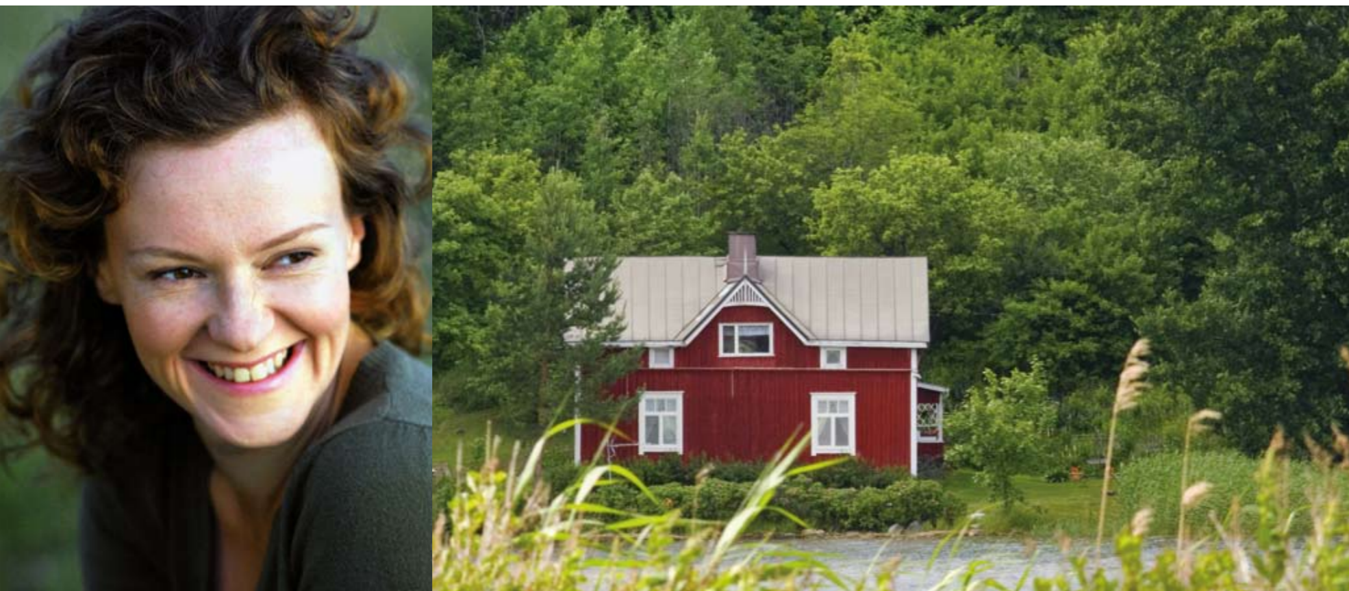
DIE SCHAUSPIELERIN MERI NENONEN, FINNISCHES „MÖKKI“ (FERIENHAUS)

TEXT: SILKE RÖTTGERS