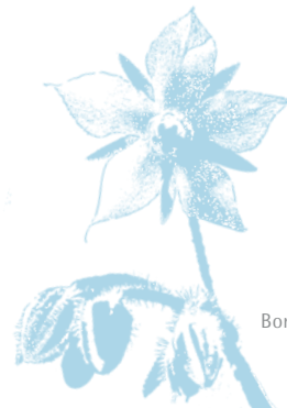
Borretsch - Borago officinalis