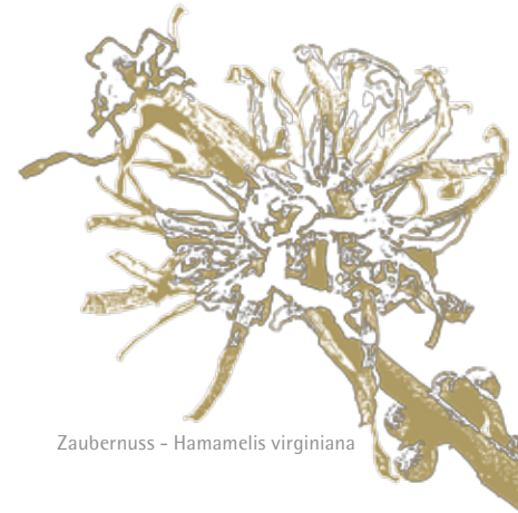
Zaubernuss - Hamamelis virginiana

An die Bedürfnisse der Haut angepasst, trägt die Dr.Hauschka Naturkosmetikerin abschließend die entsprechende Dr.Hauschka Tagespflege auf. Wundklee als Mittelpunktspflanze ist der Vermittler zwischen den abgrenzenden Tages- und den regenerierenden Nachtprozessen der Haut.