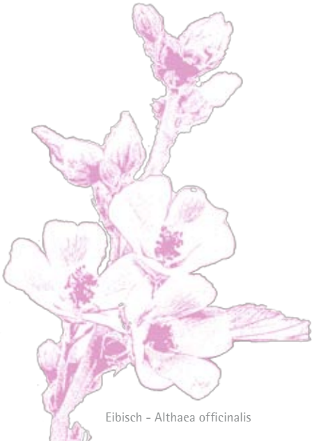
Eibisch – Althaea officinalis

Gönnen Sie sich einen Kurzurlaub der besonderen Art: Ein entspannendes Fußbad, Arm- und Handeinreibungen sowie duftende Kompressen lassen Sie tief durchatmen und sind die ideale Vorbereitung auf die anschließende Gesichtereinigung und -pflege mit der natürlichen Dr.Hauschka Kosmetik. Reinigungs- und Pflegemasken, dazu Intensivpflege mit Ampullen beleben und regenerieren. Die ergänzende Lymphstimulation mit feinen Pinseln entstaut, entschlackt und stärkt das Immunsystem. Die Klassische Behandlung hinterlässt ein Gefühl des Durchströmtheits, ein Gefühl von Licht, Leichtigkeit und innerer Balance.