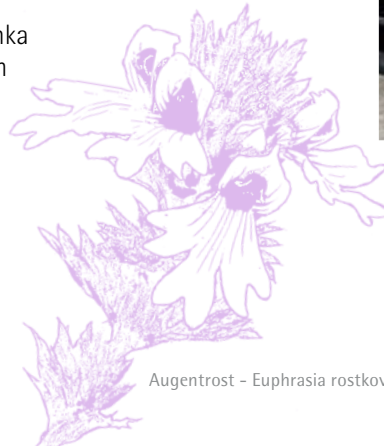
Augentrost - Euphrasia rostkoviana

Bei der Entwicklung der Serie arbeiteten Dr.Hauschka Naturkosmetikerinnen zusammen mit Künstlern an der Farbgestaltung. Das Ergebnis ist einzigartig: Die Dr.Hauschka Farbtöne besitzen ihr Eigenleben und entfalten auf jeder Haut eine ganz eigene Nuance.