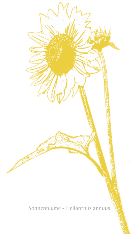
Sonnenblume - Helianthus annuus