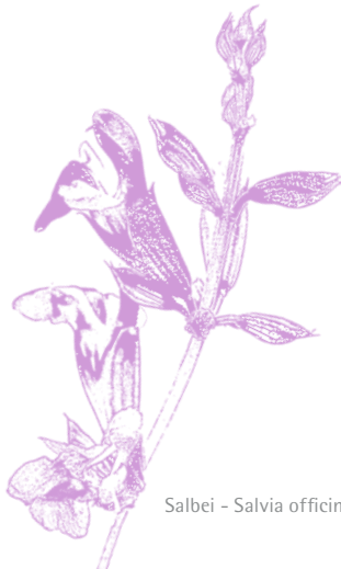
Salbei - Salvia officinalis

Die Klassische Dr.Hauschka Behandlung führt zu tiefer Entspannung und hinterlässt ein Gefühl des Durchströmteins, ein Gefühl von Licht, Leichtigkeit und innerer Balance.