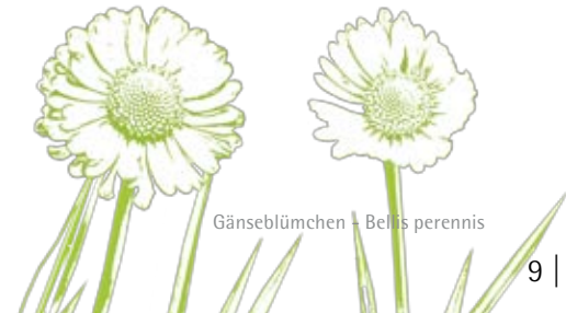
Gänseblümchen - Bellis perennis

Die Dr.Hauschka Naturkosmetikerin macht übrigens bewusst kein Peeling. Sie entfernt bei der Reinigung nur das, was die Haut von selbst abgibt. Jedes Mehr kann die Haut irritieren.